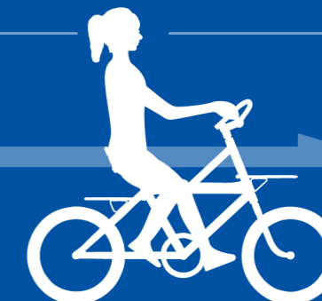
2020年 Root One