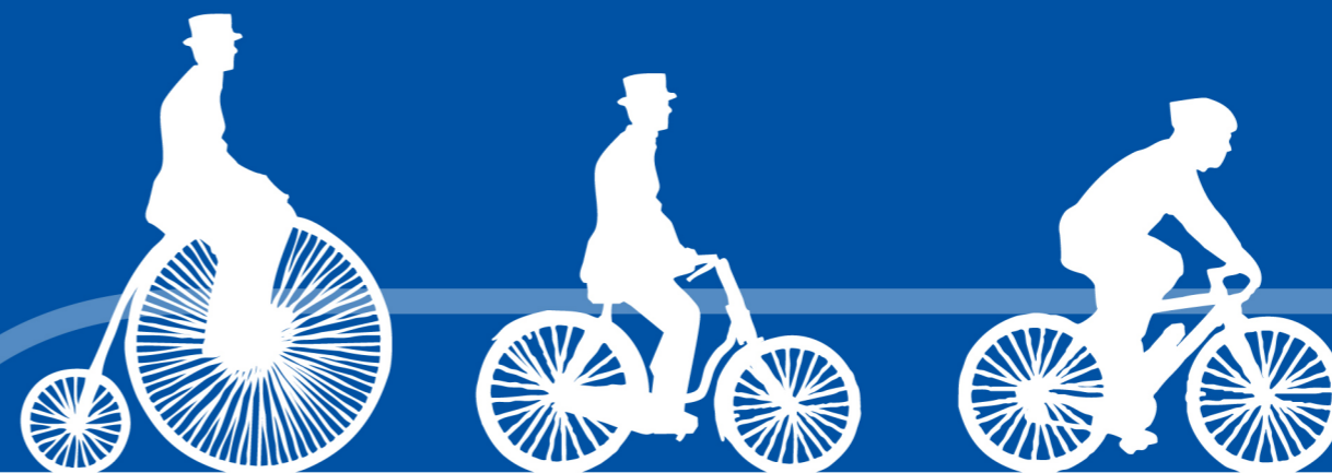
1870年頃 Penny Farthing

ルートワンは、その自転車の起源にもう一度立ち還ることで 人間にとって「安全かつ快適な乗り心地」とは何か、を試行錯誤し その要素を再構築する事で生まれた1つの進化形です。